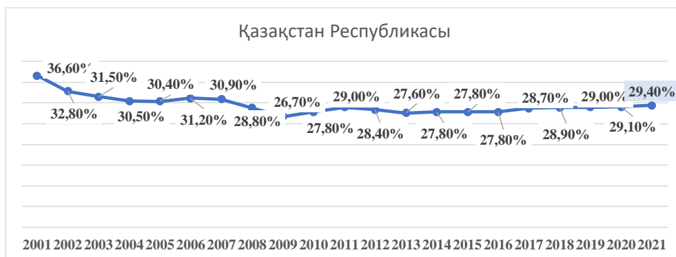
Сурет-1. Қазақстан Республикасы буюйынша Джини коэффициенті динамикасы

Экономикадағы туындайтын әлеуметтік теңсіздік пен кедейшілікті есептеп анықтауда Джини коэффициенті және халықтың 20% табысының бөлінуі және т.б. көрсеткіштер өте маңызды рөлге ие. Төмендегі суретте Қазақстан Республикасының 2010-2021 жылдар аралығындағы Джини коэффициентінің өзгеру динамикасы көрсетілген.